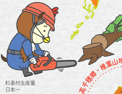
杉素材生産量日本一

羽田からはJAL、ANA、ソラドエア、成田からはジェットスター、ピーチが運航しています。